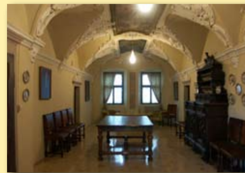
Sala degli stucchi

È un momento di incontro importante per l'inserimento nella vita istituzionale della Cassa alla vigilia dell'Assemblea annuale dei Soci, che offre ai nuovi soci la possibilità di vivere con responsabilità e consapevolezza la scelta di essere Socio.