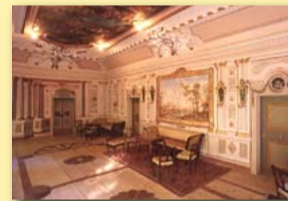
Sala Palazzo Martini

Nel corso del 2007 ed in questi primi mesi del 2008 sono entrati 44 nuovi Soci, portando il numero totale di soci a 1643 unità. A loro dedicheremo una serata per approfondire la conoscenza della Cassa Rurale e del mondo della Cooperazione Trentina.