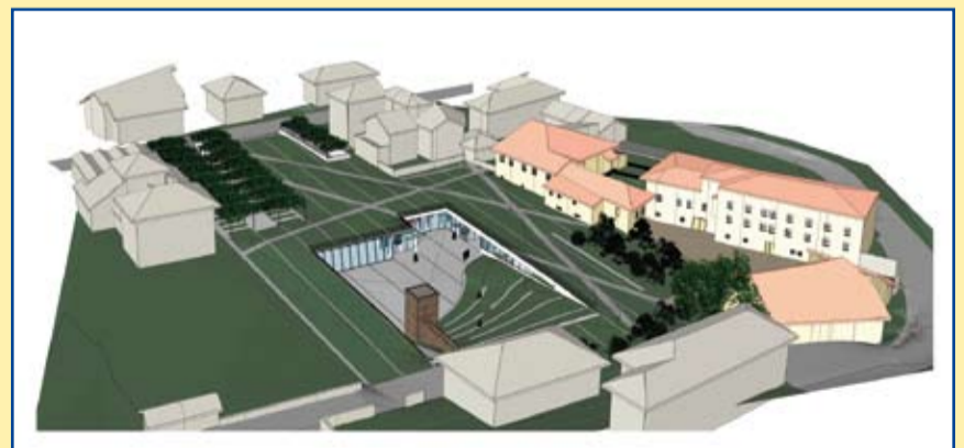
Simulazione in tridimensionale della nuova sede

Il progetto nei suoi dettagli, i costi e le modalità di realizzazione, la previsione dei tempi necessari al completamento dell'opera, saranno oggetto di un puntuale approfondimento dedicato ai Soci ed alla Comunità che contiamo di poter proporre nel corso dell'inverno. Desideriamo nel frattempo ringraziare per l'importante risultato raggiunto tutte le realtà ed i professionisti che ci hanno accompagnato, consigliato ed aiutato in questo percorso, ed in particolare la Soprintendenza ai Beni Architettonici della P.A.T., l'Amministrazione Comunale, i progettisti che hanno trovato nei vincoli e nelle difficoltà sottese al progetto un importante stimolo per proporre e sviluppare un'idea e un'opera importante per il futuro operativo della Cassa, inserita in spazi e servizi che daranno un indiscutibile valore aggiunto al centro di Mezzocorona.