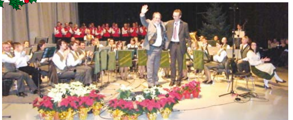
Concerto di Natale 2007

i nostri migliori Auguri per un Sereno Natale ed un Felice 2009!